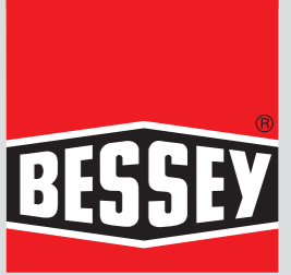
Tabela doboru ścisków